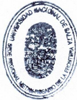
Mg. PATRICIA A. NAYAR DIRECTORA UNIVERSIDAD NACIONAL DE SALTA SEDE REG. METAN - R° DE LA FRONTERA