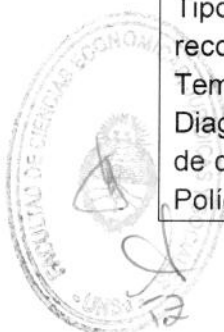
Diagrama de tallo y hoja. Distribuciones de frecuencias según tipos de variables. Intervalos de clase. Frecuencias absolutas y relativas. Frecuencias acumuladas. Histograma. Polígono de frecuencias. Polígono de frecuencias acumuladas. Gráfico de bastones.

Tema 2. Organización y presentación de datos univariados.